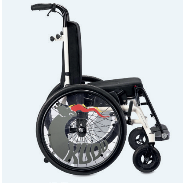
Kudu työntökahvoilla ja pyöränjarruilla