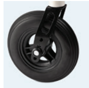
7" umpinaiset tai ilmatäytteiset tukipyörät (yhdistettävissä vain 22" ja 24" kelauspyörien kanssa)