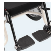
Erilliset jalkatuet (saatavissa koolle 2+3+4)