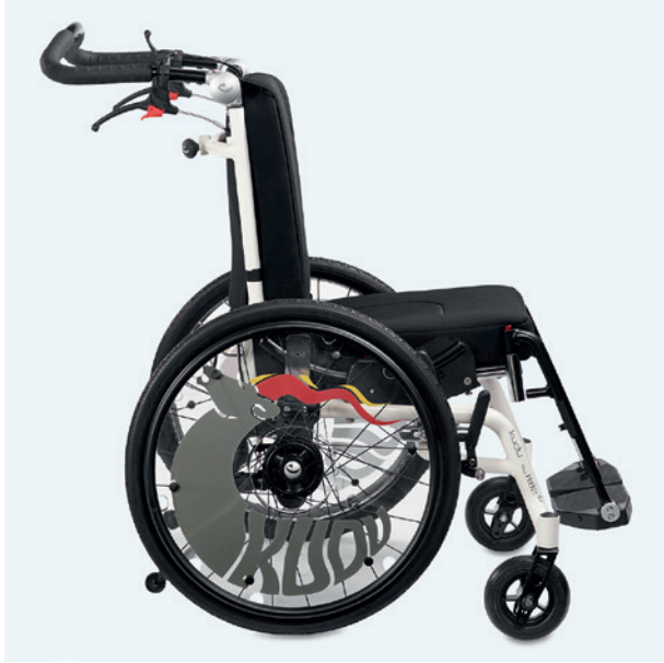
Kudu työntötangolla, rumpujarruilla ja pyöränjarruilla

Kudu on saatavissa neljässä eri koossa. Se voidaan tilata joko erillisillä työntökahvoilla tai kulmasäädettävällä yhtenäisellä työntötangolla.