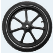
12½"/16" Umpinaiset tai ilmarenkaat

Kelauspyörien koko on valittavissa. Koot 20", 22" ja 24" ovat saatavissa vakiotoimituksena pikalukituksella.