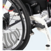
Pyöränjarrut (saatavissa koon 20", 22" ja 24" pyöriin)