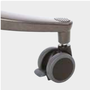
75 mm:n tai 100 mm:n pyörät Jarrut kaikissa 4 pyörässä