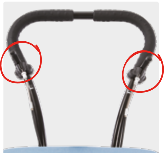
Korkeuden ja kallistuksen säätöpoljin työntötangolla