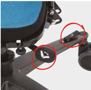
Korkeus- ja kallistussäätöpoljin rungolla, kallistussäätökahva istuimen alla