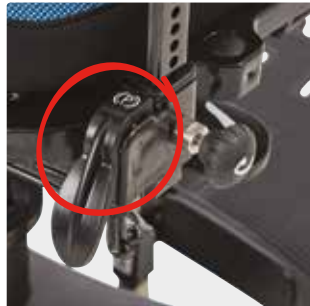
100 mm:n pyörät Saatavana keskujarrulla