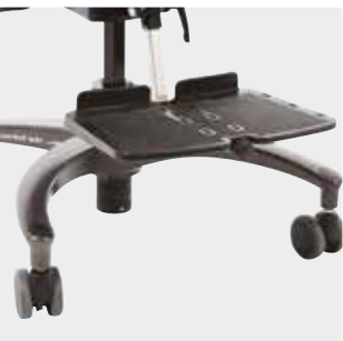
Istuimen alle asennettu