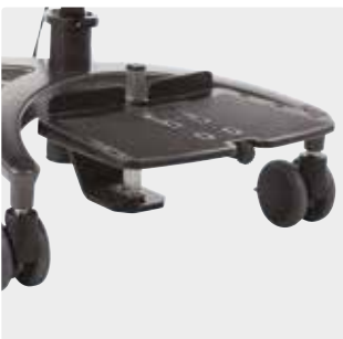
Rungolle asennettu (Suositellaan kääntötoiminnon yhteydessä)