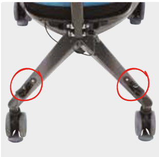
Korkeuden ja kallistuksen säätöpolkimet rungolla olevalla polkimella