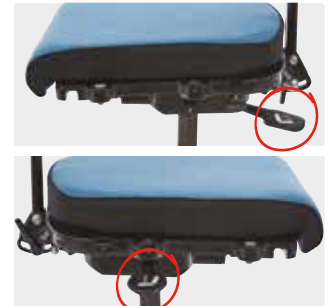
Korkeuden ja kallistuksen säätökahva istuimen alla