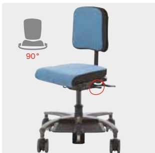
Saatavana 90°:n kierroilla Käyttö istuimen alla olevalla kahvalla