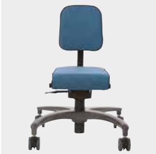
Saatavana koossa 1, 2 ja 3