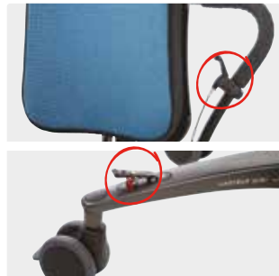
Korkeus- ja kallistussäätöpoljin rungolla, kallistusvipu työntötangolla