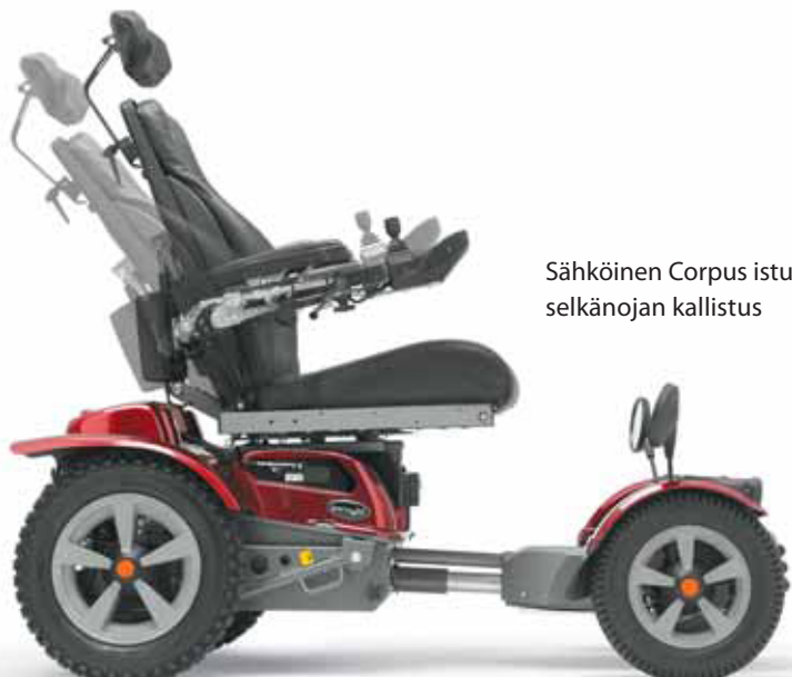
Sähköinen Corpus istuimen selkänojan kallistus