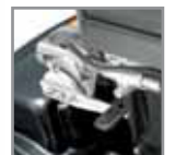
180° kääntyvä istuin, manuaalinen tai sähköinen