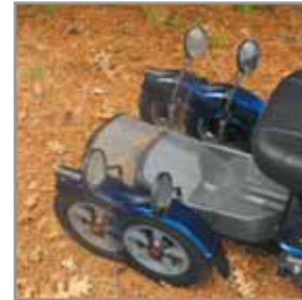
Alustaa voidaan pidentää ja säätää yksilöllisten tarpeiden mukaan