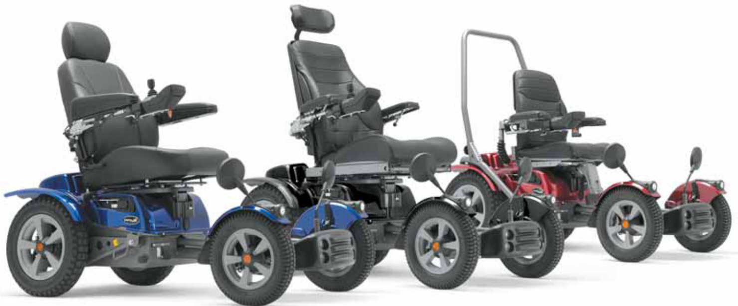
X 850 C S