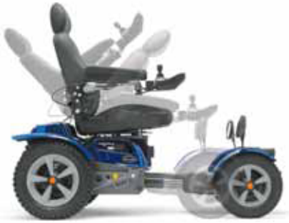
Manuaalinen selkänojan kallistus