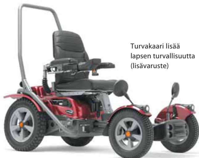
Turvakaari lisää lapsen turvallisuutta (lisävaruste)