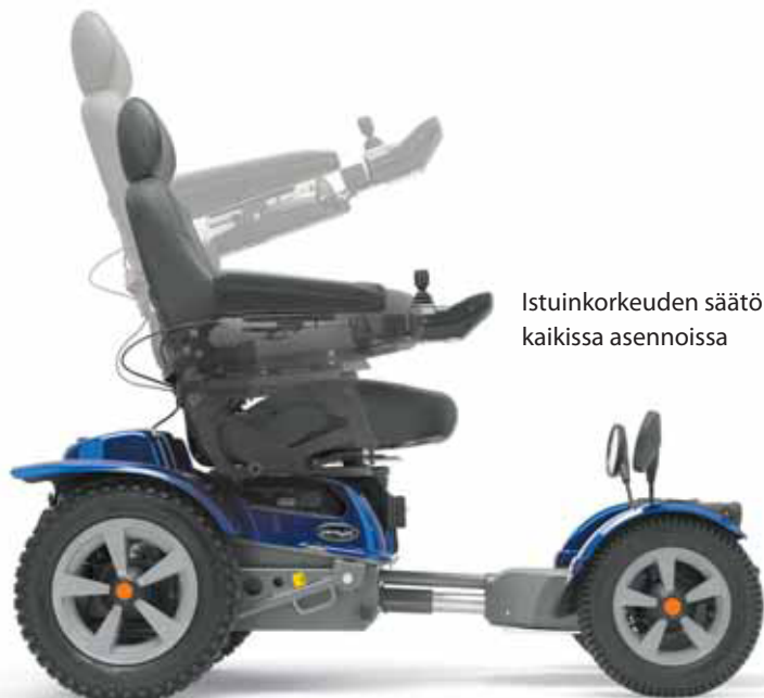
Istuinkorkeuden säätö kaikissa asennoissa