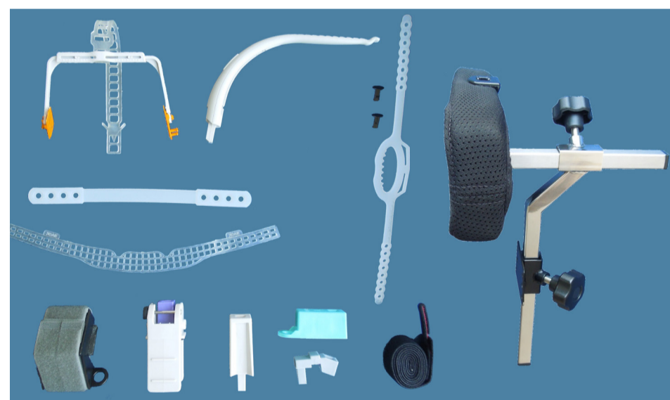
Headpod Kit Max (HP104)