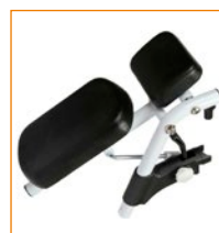
302128 (vasen)/ 302129 (oikea) Amputaatiotuki