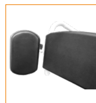
30212P (pieni 10×14 cm)/ 30212Q (suuri 14×20 cm) Vartalotuet sivulle