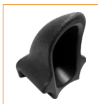
30214U Roiskesuoja istuimen eteen.