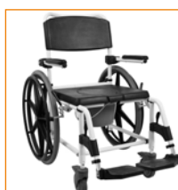
302017 perusmalleihin/ 202023 Tilt-malleihin 24" kelauspyörät ja jarrut