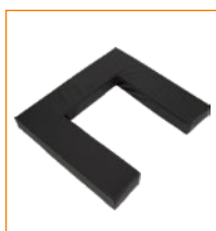
30210U Pehmuste istuimeen, edestä auki.