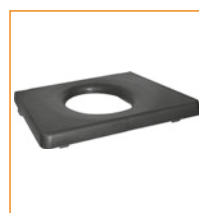
302109/302154/302156 Istuinpehmuste ovaalilla aukolla (27×19), edestä kiinni.