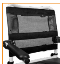
302164/302165/302166 Verkkoselkäosa tarrasäädöin.