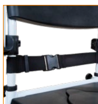
302122 Lantiovyö muovilukolla.