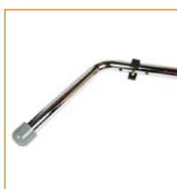
302125 Kippieste, kun käytetään 24" pyöriä (asennus ei vaadi työkaluja).