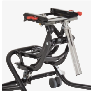
Kiinnitysosa erillisille jalkalevyille 8910840-2