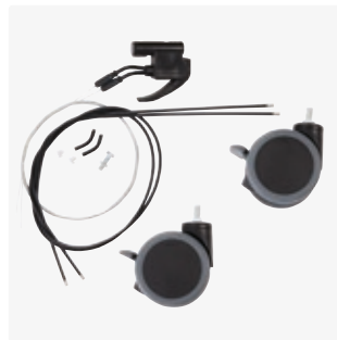
Käsiikäyttöisen keskusjarrun asennuskitti 890011-x