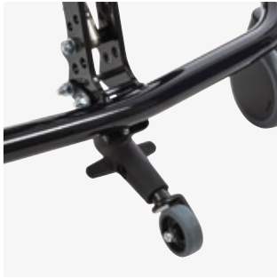
Kippieste sisäalustaan 890007