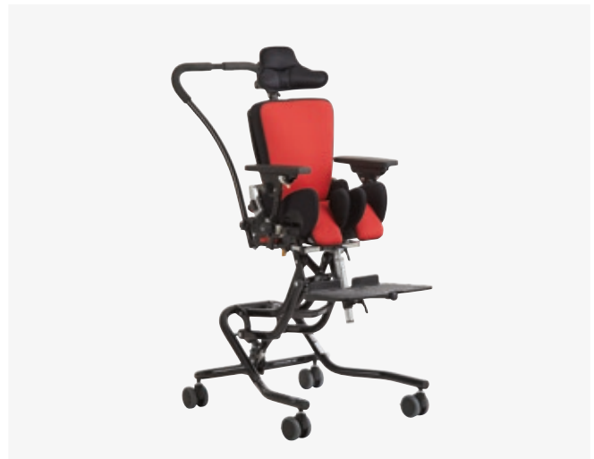
High-low:xo-alusta - x:panda-istuin kiinnitettyinä.