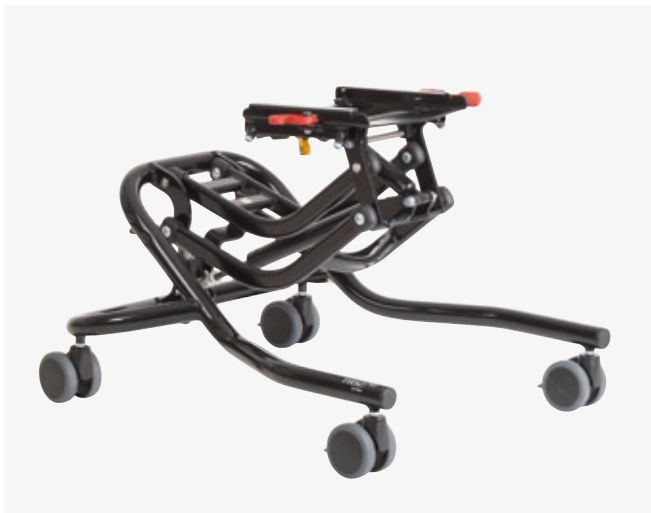
High-low:xo-alusta koko 1 kaasujousella.