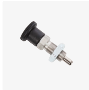
Korkeussäädön lukitus 890024