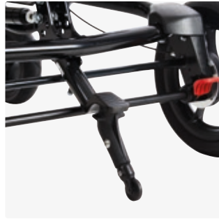
Kippieste kuljetusalustaan 890008