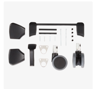
Asennuskitti jalallakäyttävään keskusjarruun 890012-x