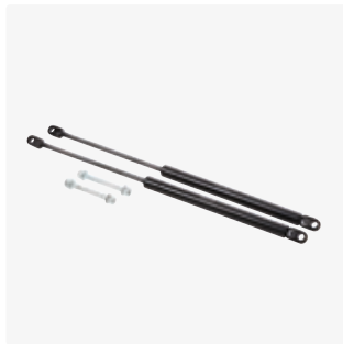
Lisä kaasujouset 890001