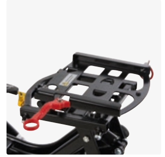
Stingrayn adapteri 890015-04