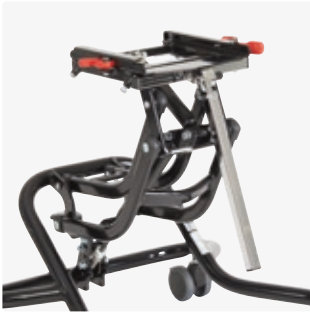
Kiinnitysosa yhtenäiselle jalkalevyille 8910820-2