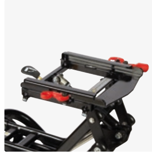
X-Pandan adapteri 8911610-04