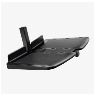
Yhtenäinen jalkalevy (Wombat)