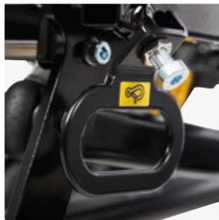
Kuljetuskiinnikkeet vain kuljetusalustaan 890005