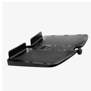
Yhtenäinen jalkalevy (Wombat)