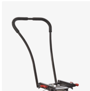
Työntökaari sisäalustaan 890009-04