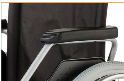
Taakse taitettavat, lukittavat käsituet.