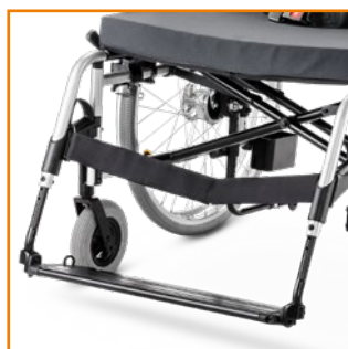
Yhtenäinen jalkatuki syvyyden- ja kulmansäädöllä.

Pyörätuoli on törmäystestattu ja hyväksytty ISO 7176-19 standardin mukaisesti.