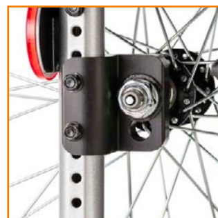
Kuljetuspyörän paikkaa voi muuttaa, joka vaikuttaa kelausherkkyyteen.

Tuote on CE-merkitty lääkinnällinen laite.