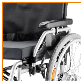
Käsitukien korkeuden- ja syvyyden- säätömahdollisuus.