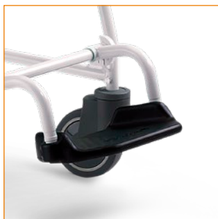
Istuimen alle taitettava ja korkeussäädettävä jalkatuki.