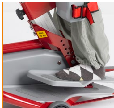
0451000 Säädettävä jalkatuki (pienikokoiset käyttäjät maks. 75 kg).