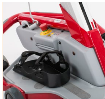
0452100/200/300 Sandaalit tukemaan jalkaterät paikalleen (koot S-L).

Tuote on CE-merkitty lääkinällinen laite.