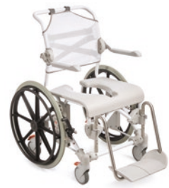
Etac Swift Mobil 24"-2