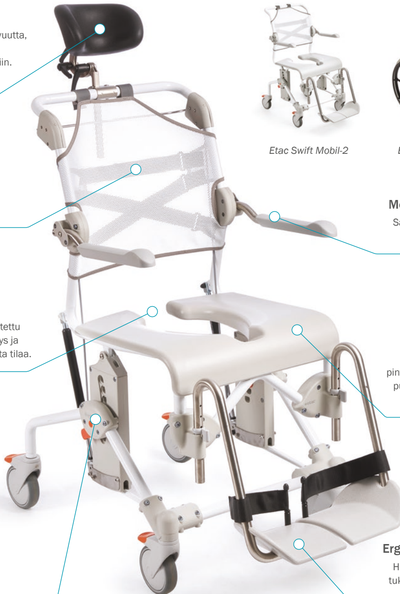
Etac Swift Mobil Tilt-2

Hieman kaarevat jalkatuet tukevat jalkapöytää ja jalan kaartamista näin mukavuuden, vakauden ja rentouden.