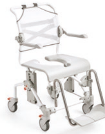
Etac Swift Mobil-2

Helppo säätää erilaisiin kiinteisiin istuinkorkeuksiin ilman työkaluja.