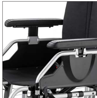
Käsitukien korkeuden- ja syvyydensäätömahdollisuus.