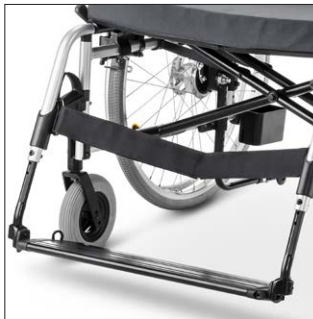
Yhtenäinen jalkatuki syvyyden- ja kulmansäädöllä.

Pyörätuoli on törmäystestattu ja hyväksytty ISO 7176-19 standardin mukaisesti.