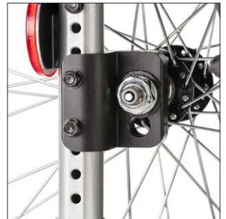
Kuljetuspyörän paikkaa voi muuttaa, joka vaikuttaa kelausherkkyyteen.

Tuote on CE-merkitty lääkinällinen laite.