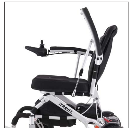
Käsituet taittuvat ylös

Tuote on CE-merkitty lääkinällinen laite.