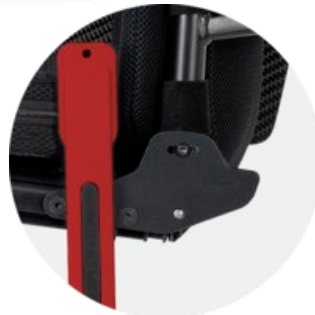
Selkätuen kulman säätömahdollisuus ja taittomekanismi lukituksella.