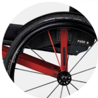
Pystysuora kannake takana, jossa on piilotettu istuimen korkeuden säätö ja sivusuojan kiinnitys.