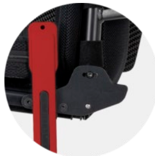
Selkätuen kulman säätömahdollisuus ja taittomekanismi lukituk-sella.