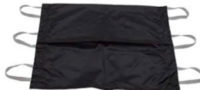
X-Ray Master Digital -kasettipussi, koko 58x58 cm