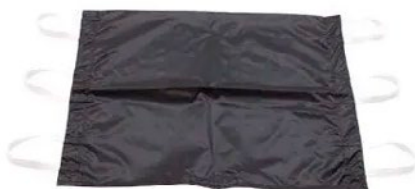
X-Ray Abdome -kasettipussi, koko 50x55 cm