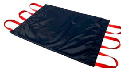
X-Ray Master Thorax -kasettipussi, koko 43x50 cm

Tuotteet ovat CE-merkittyjä lääkinällisiä laitteita.