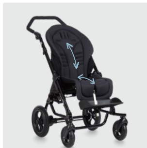
Mukautuvuutta ja räätälöityä tukea