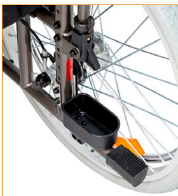
Heijastimet, keppiteline ja polkaisuputki.