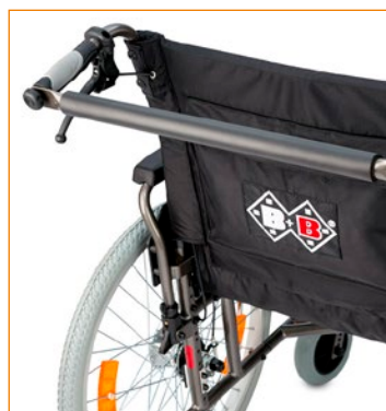
Tukevoittajatanko vakiona mukana.