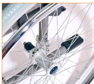
Kelauspyörän säädöt ja polkaisuputki. Pyörätuoli kokoontaitettuna.