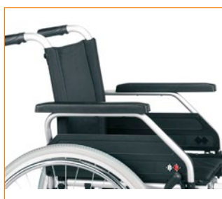
Taaksetaittavat käsituet säädettävien pehmustein.