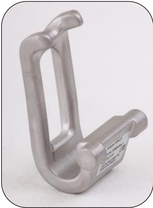
3136016, Adapteri MR/LR