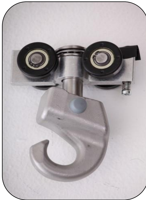
3136015, Liukupyörä "koukku" MR/LR