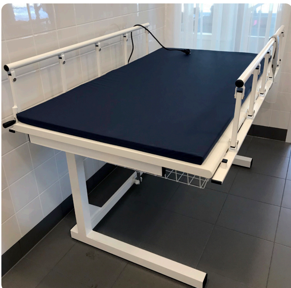
Päiväkoti Hollola, Suomi