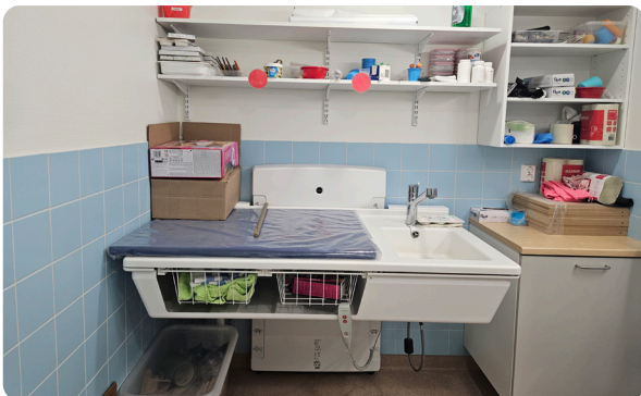
Päiväkoti Alavus, Suomi