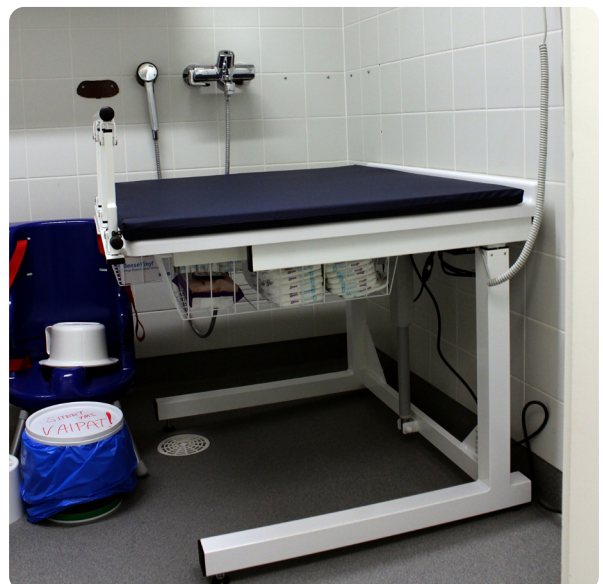
Päiväkoti Järvenpää, Suomi