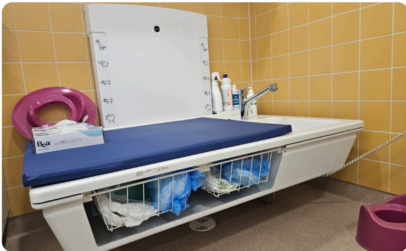
Päiväkoti Alavus, Suomi