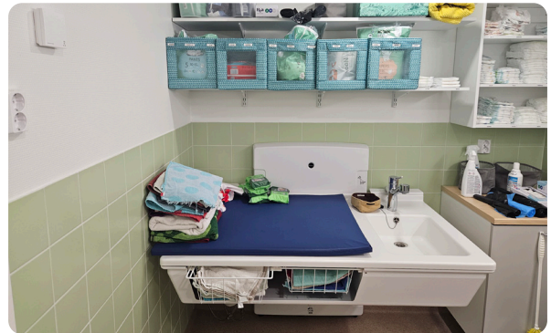
Päiväkoti Alavus, Suomi