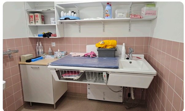
Päiväkoti Alavus, Suomi